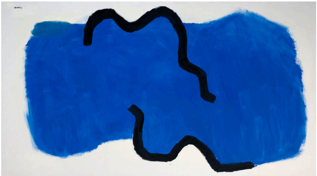
Agustín Ibarrola Sin título , 2009 Colección FMCMP