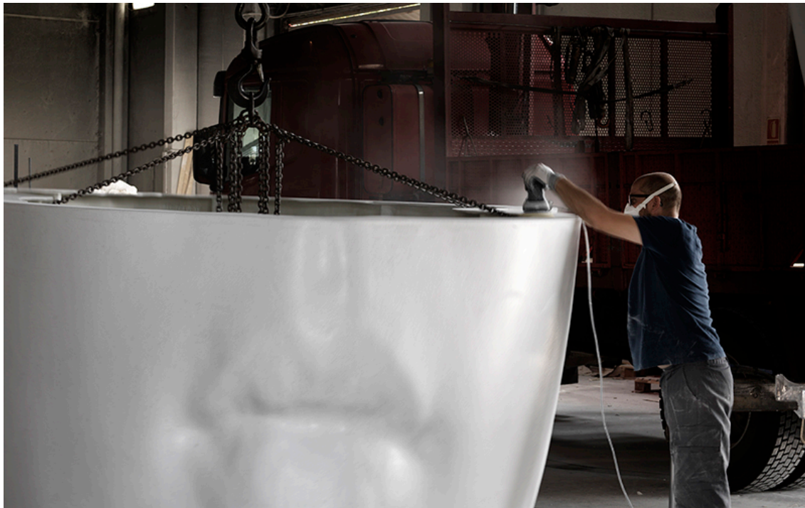
Proceso de construcción de Julia de Jaume Plensa

Desde marzo de 2013, la Fundación M a Cristina Masaveu Peterson es, además, la gestora de la Colección Masaveu, uno de los fondos artísticos privados más importantes de España.